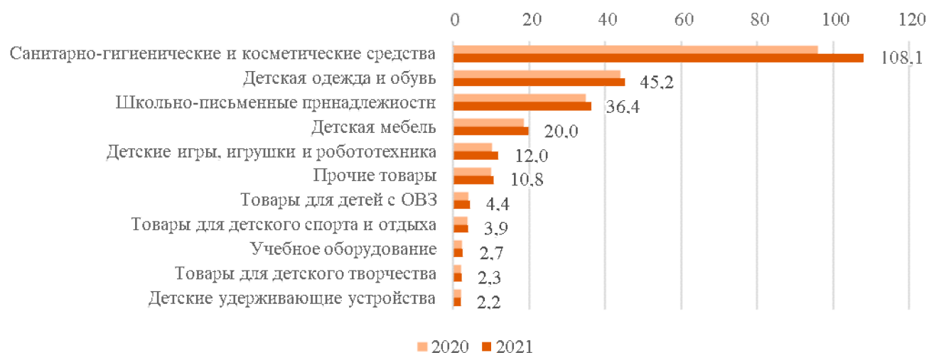
Прогноз производства товаров для детей в 2021 г., млрд руб.

Объем рынка товаров для детей в 2020 году составил 832 млрд рублей (2019 г. – 843 млрд рублей), при этом на 1 600 российских производителей пришлось 228 млрд рублей.